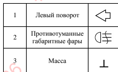
Рис.2. Схема подключения электрооборудования